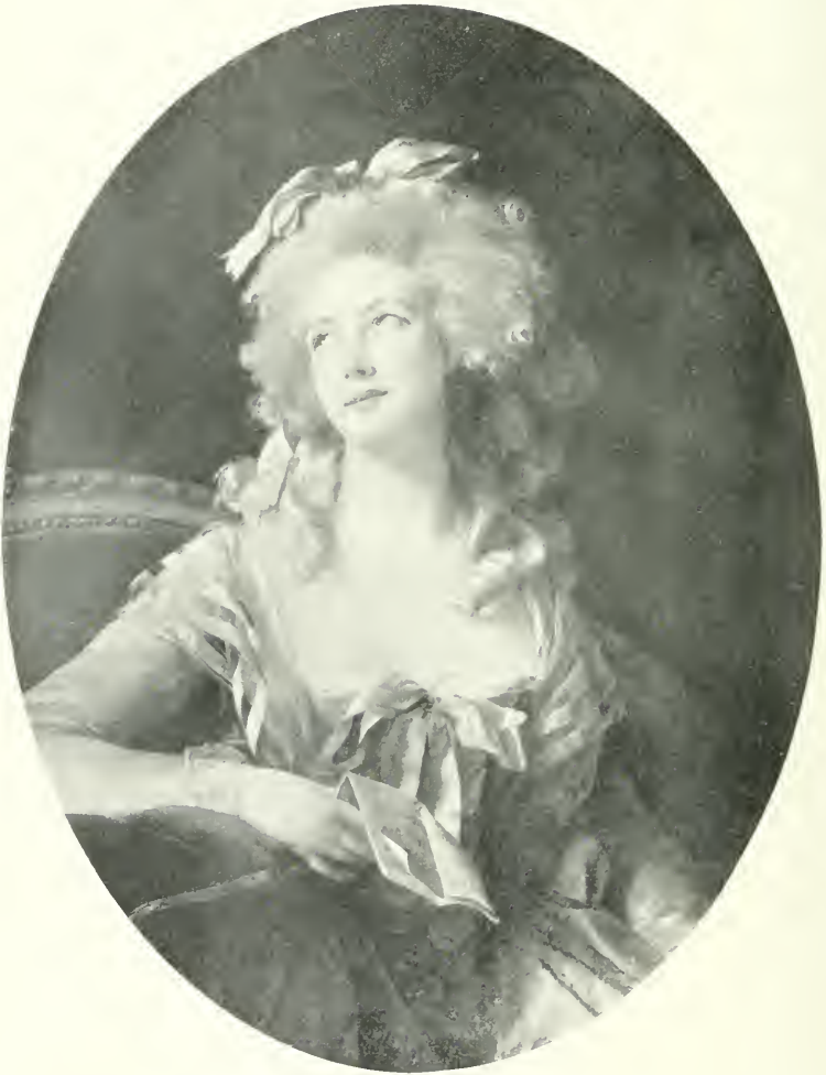
MADAME GRAND, PRINCESSE DE TALLEYRAND